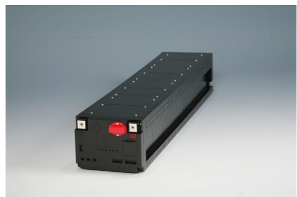
②ULTIMO 多連結モジュール