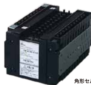
角形セルモジュール