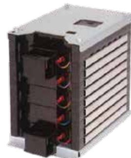
ラミネート形セルモジュール